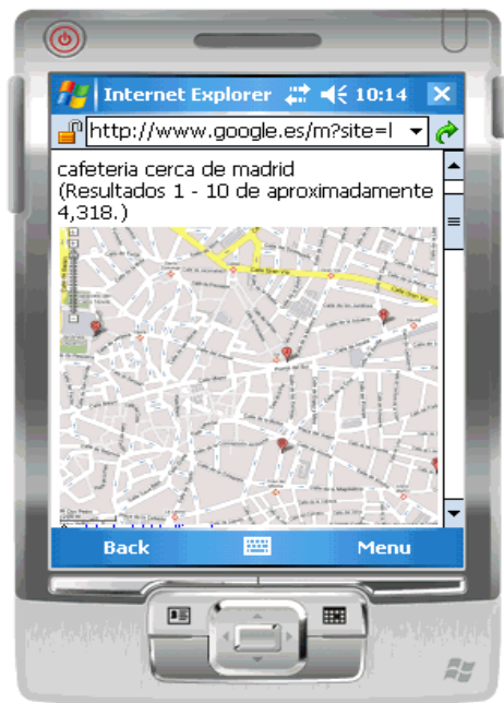
Figura 1. Ejemplo de salida multimodal a la consulta “¿Dónde hay una cafetería en Madrid?”.

Además, en caso de que el cliente disponga de un sistema GPS ( Global Positioning System ) se utiliza la información de posicionamiento para precisar la respuesta.